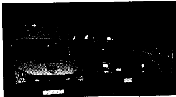
זירת התאונה בכביש 4. הקצינים התנגשו במשאית כשחזרו מבילוי במרכז

בנוסף להערה שתירשם בתיקו, קבע הרמטכל"ל כי מפקד הפלגה, אשר מסיים את תפקידו בימים הקרובים, לא יוכל לשמש בתפקידי פיקוד במשך השנתיים הבאות. "אחריות ומשמעת הן מהיסודות המשמעותיים בדמותו של מפקד ולאורם עליו להוביל את פקודיו" אמר גנץ בסיכום התחקיר.