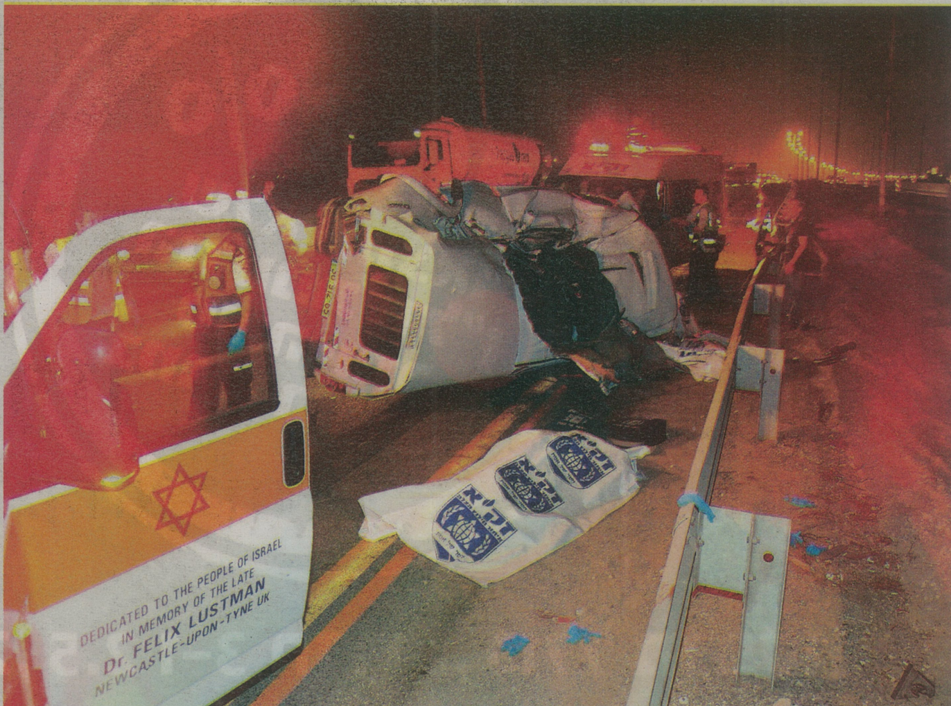
הרכב סטה ממסלולו מסיבה בלתי ברורה. זירת התאונה בכביש 4, אתמול