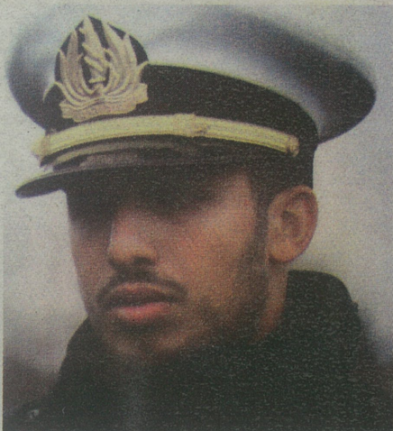
מצטיין הרמטכ"ל. עומרי שחר