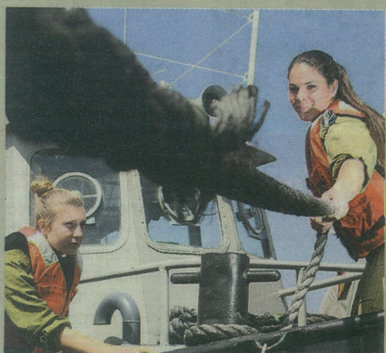
"מתייחסים אלינו כנהגות משאיות". בנות הגוררת בפעולה

טון מים בשנייה". הופ, היא סבה על צירה, מבצעת סיבוב על המקום בים. הופ, זינקנו, הופ, רעדנו, הופ, טולטלנו. נשימתי נעתקת. די. הצוות מוריד מטרה נגררת לים. הצוות מפעיל את מקלע החזית או שמא זהו מקלע האחוריים. פוצח המק" לע באש. מחלת הים אוחת בי. הכמוראויב חוסל. כולם סביבי שמחים, גלים ורוח ואש, מופע מרהיב. "קח, תנסה בעצמך את ההגה", מוסר לי המפקד, אבל נפשי שואפת עתה רק ליבשה יציבה. לרציף. לשקט. לתחושת אספלט תחת רגליי. הצילו! לרגע הופך הכתב האומלל ממחלת הים המתחילה שלו לבידור הסיפון, אבל טוב לכם משיבני לחוף. יבורך רציף הבטון. תבורך האדמה. פתאם אני מבין למה כרעו ברך עולים חדשים משך הדורות, נשקו את ארמת הנמל בבואם לפה אחרי מסע ים. ●