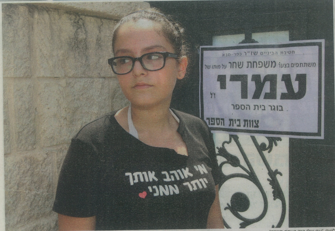
לוטם. "אח שלי היה באמת מיוחד"

"אם רק יו נותנים לי לראות אותו עוד עם אחת, הייתי אומרת לו שהוא בן אדם יחיד ואח'תפארת. הייתי ספרת לו מה הרבה אנשים שאפילו הוא לא מכיר ידו אותו בלוויה"